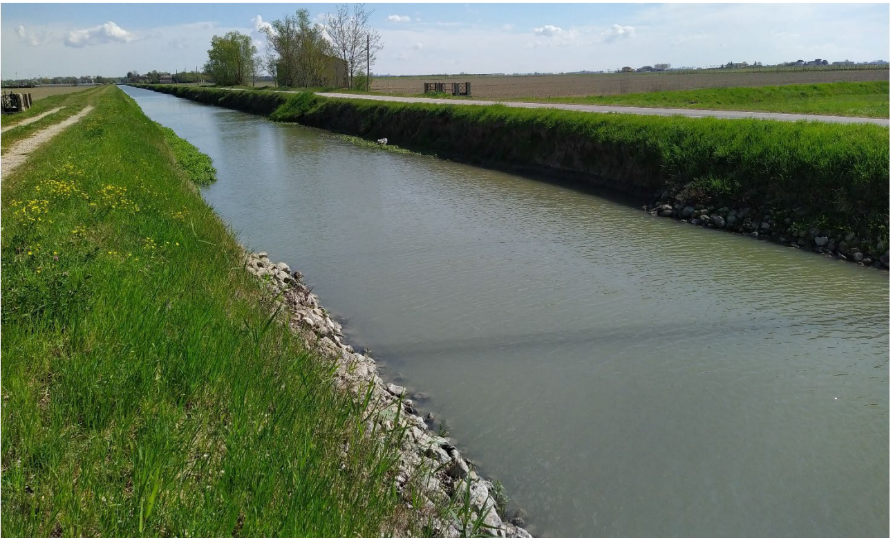
FIGURA - 3 – PARTICOLARE DEL CEDIMENTO SPONDALE