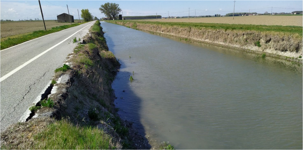
FIGURA - 2 – PARTICOLARE DEL CEDIMENTO SPONDALE