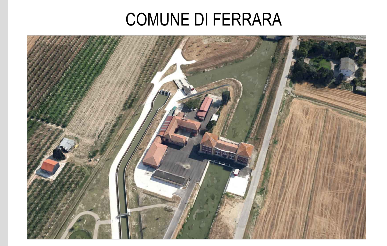
COMUNE DI FERRARA

RESTAURO CONSERVATIVO E RISTRUTTURAZIONE DEI FABBRICATI ANNESSI ALL'IMPIANTO IDROVORO SANT'ANTONINO PER LA REALIZZAZIONE DI ARCHIVIO E BIBLIOTECA DEL CONSORZIO. IMPORTO COMPLESSIVO DELL'OPERA € 610.296,00.