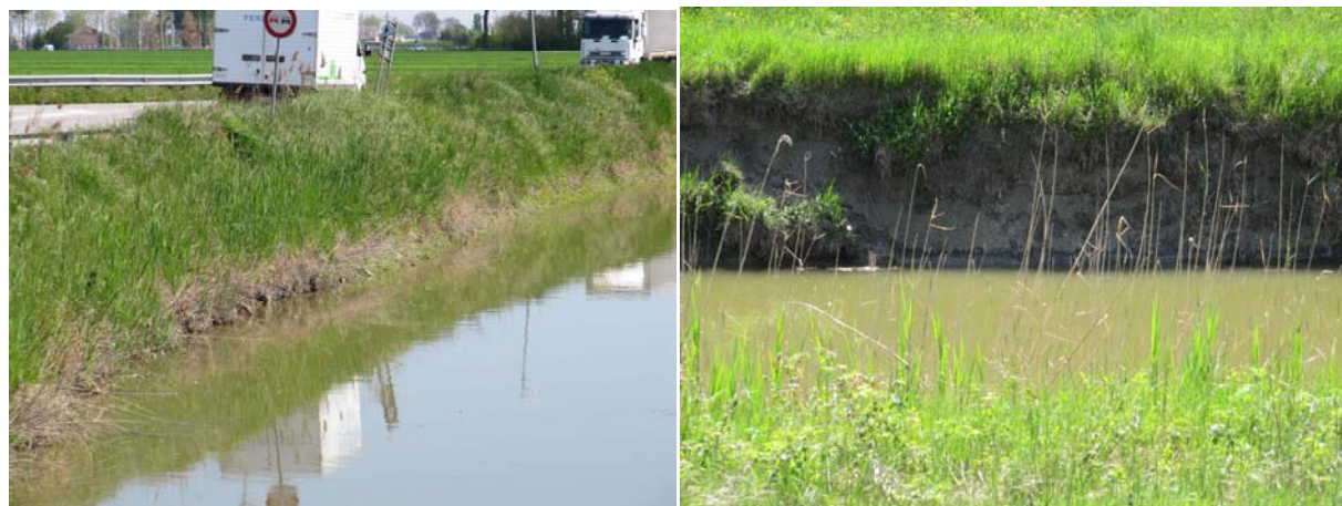
FIGURA - 3 – PARTICOLARI DEI CEDIMENTI SPONDALE