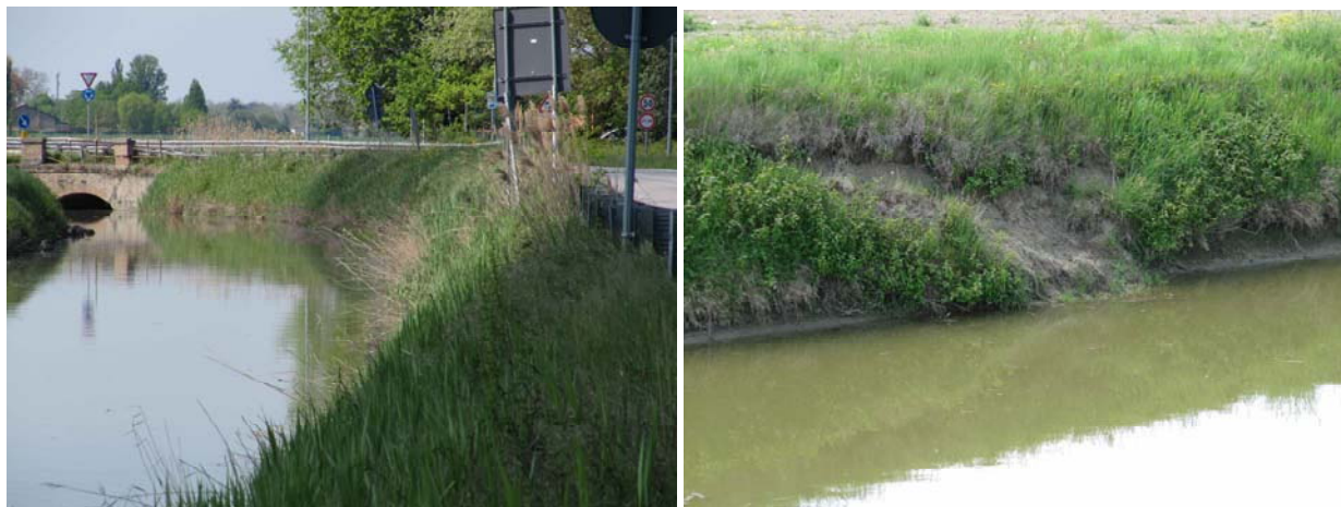
FIGURA - 2 – PARTICOLARI DEI CEDIMENTI SPONDALE

Il piano sopracitato inserisce, tra gli interventi finanziati con risorse dell'Ordinanza del Capo Dipartimento della Protezione Civile n. 558 del 15/11/2018, l'opera di cui al titolo, per un importo complessivo di € 100.000,00 e individua, quale soggetto attuatore, il Consorzio di Bonifica Pianura di Ferrara.