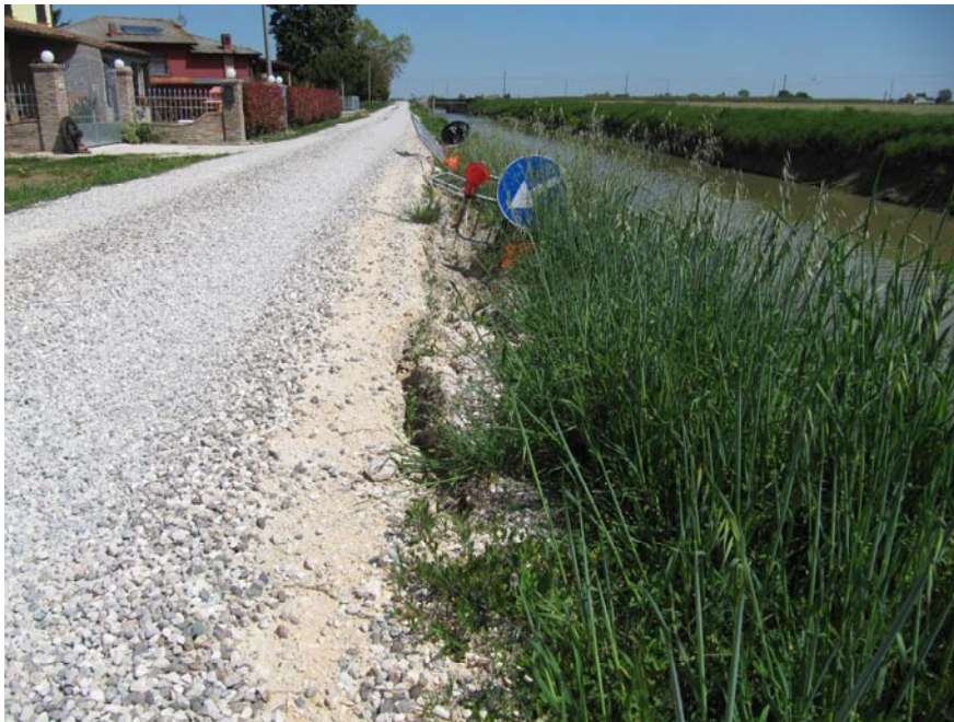
FIGURA - 2 – PARTICOLARE DEL CEDIMENTO SPONDALE

Il piano sopracitato inserisce, tra gli interventi finanziati con risorse dell'Ordinanza del Capo Dipartimento della Protezione Civile n. 558 del 15/11/2018, l'opera di cui al titolo, per un importo complessivo di € 270.000,00 e individua, quale soggetto attuatore, il Consorzio di Bonifica Pianura di Ferrara.