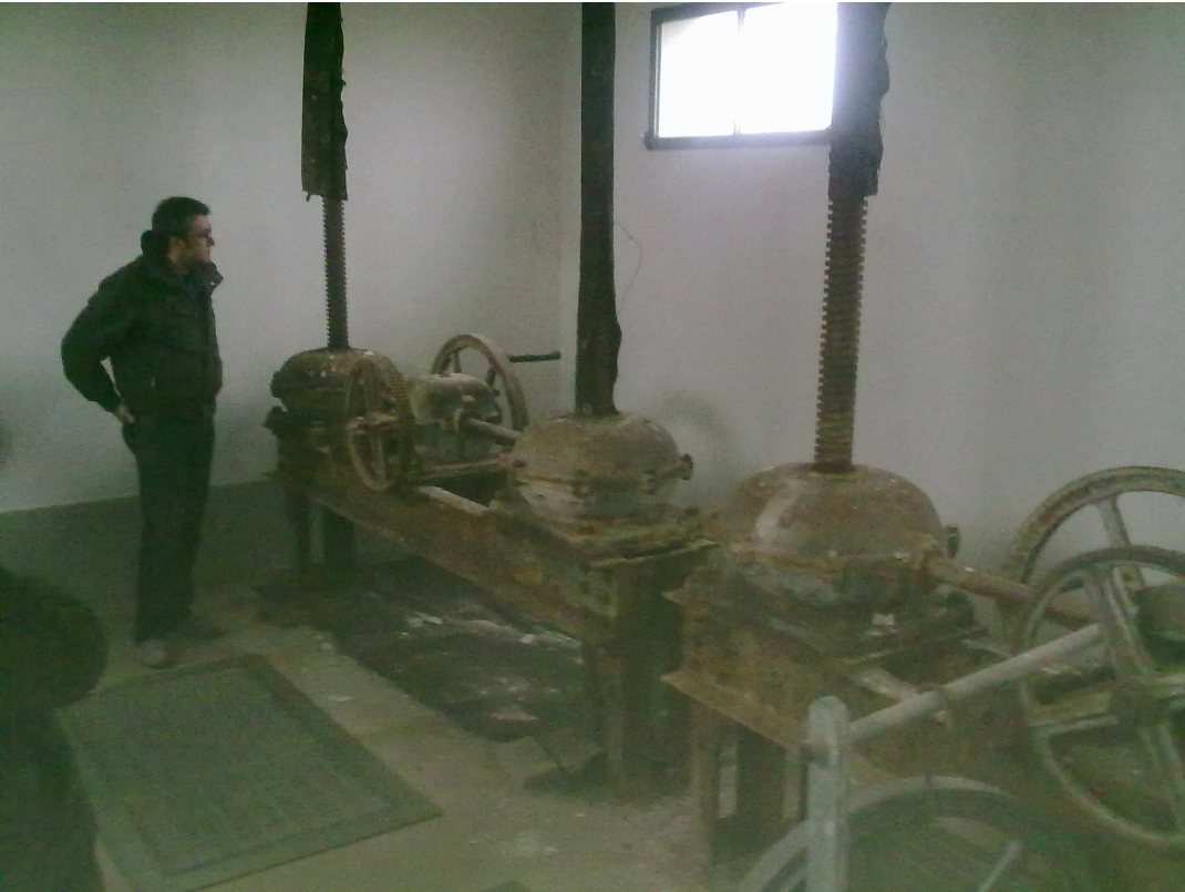
Fig. 5 – Manufatto botte sotto Primaro