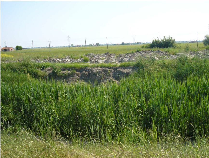
Figg. 1 e 2 – Tratti franati nel tronco oggetto di intervento