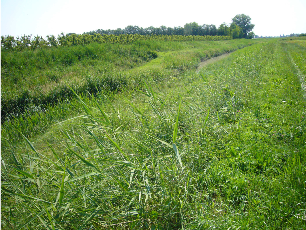
Fig.3 – Alveo dissestato nel tratto oggetto di intervento