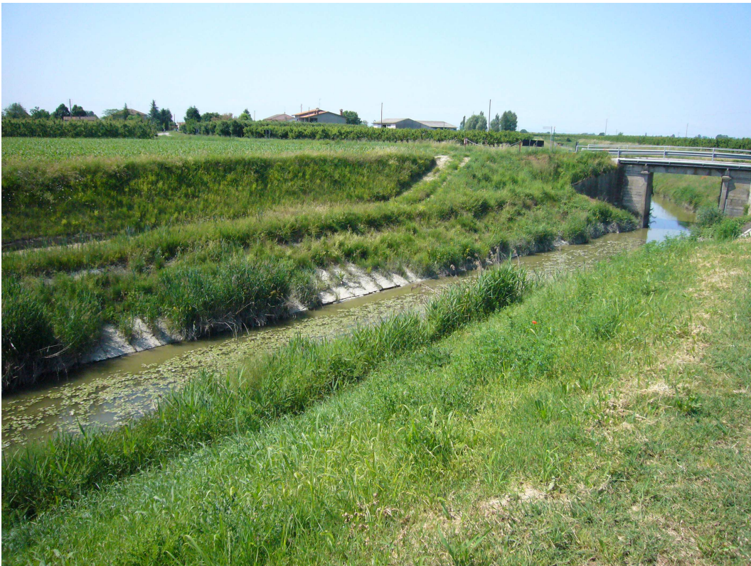
Fig.7 – Rampa già esistente per l'accesso al nuovo manufatto