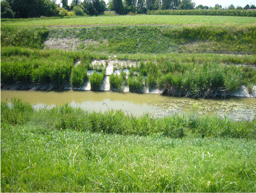
Fig. 6 – Dissesto del rivestimento dello Scolo Principale Inferiore in arrivo alla botte