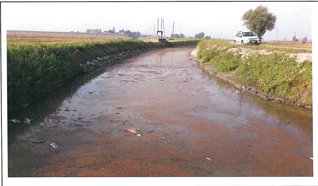
Visuale scatta dal cavedone verso monte (ovest)