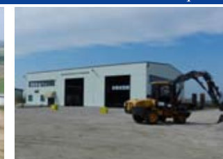
Centro Operativo Torniano