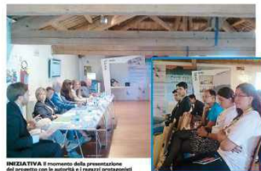
INIZIATIVA Il momento della presentazione del progetto con le autorità e i ragazzi protagonisti COMACCHIO IL PROGETTO È PATROCINATO ANCHE DALL' UNESCO Arrivano volontari da tutto il mondo per la pulizia e la cura del territorio

MERCOLÌ 17 SETTEMBRE 2014 il Resto del Carlino COMACCHIO E LIDI COMACCHIO NUOVA ASSOCIAZIONE NO PROFIT FRA I GIOVANI La NATA a Comacchio una nuova associazione no profit di giovani. Ha preso il nome di Maraisus, che in comacchese significa girasole; per indicare la comacchiesità che vuole contraddistinguere. Nove i ragazzi dai 18 ai 40 anni che hanno messo in piedi il gruppo.