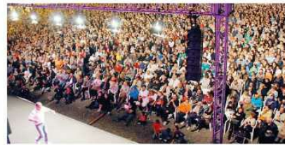
La Fiera che oltre sera in piazza Garibaldi ha assistito allo spettacolo conclusivo della Fiera di Argenta