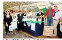
L'apertura della Cia ha avuto nella sala di Palazzo

«Quest'anno la crisi del settore è notevole, quasi tutte le colture sono in netta perdita»