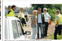
L'entrata tra amministrato e civile, sotto il ponte bastia