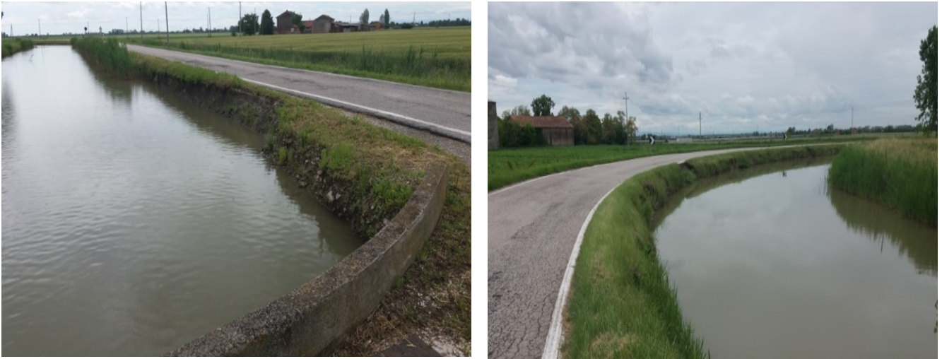
FIGURA - 3 – PARTICOLARI DEL CEDIMENTO SPONDALE