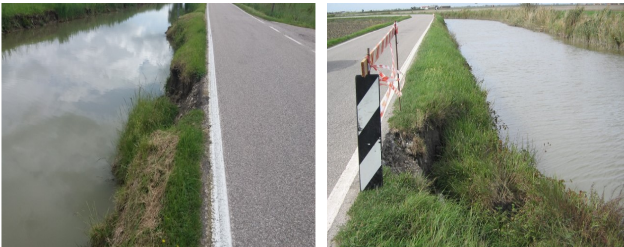
FIGURA - 2 - PARTICOLARI DEL CEDIMENTO SPONDALE

Il piano sopracitato inserisce, tra gli interventi finanziati con risorse dell'Ordinanza del Capo Dipartimento della Protezione Civile n. 600 del 26/07/2019, l'opera di cui al titolo, per un importo complessivo di € 100.000,00 e individua, quale soggetto attuatore, il Consorzio di Bonifica Pianura di Ferrara.